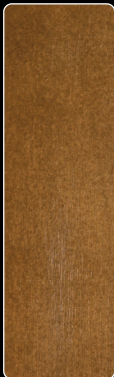
E-03 OLCHA CIEMNA