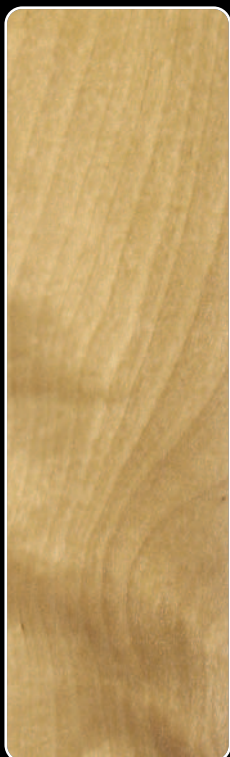
E-02 OLCHA JASNA