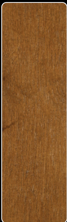
K-06 CZEREŚNIA ORLAND