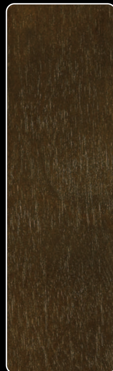
E-04 DĄB CANTERBURY