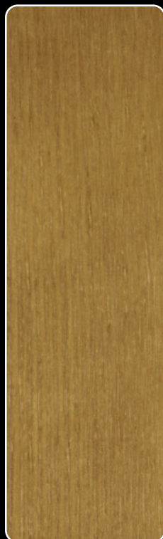
R-01 DĄB RUSTYKALNY