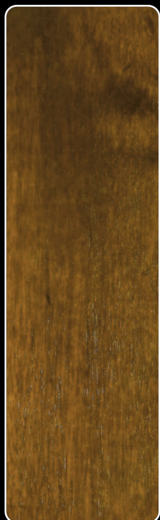
K-04 CZEREŚNIA ANTYCZNA